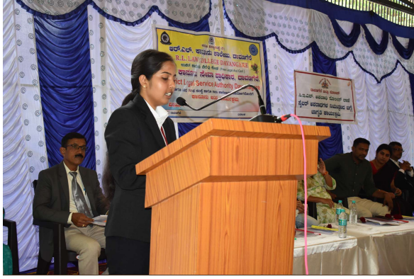
HOSTING THE PROGRAMME