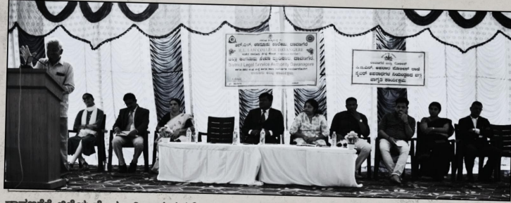
ದಾವಣಗೆರೆ: ಜಿಲ್ಲೆಯ ದೊಡ್ಡಬಾತಿ ಗ್ರಾಮದ ತಪೋವನ ಕಾಲೇಜಿನಲ್ಲಿ ಆರ್.ಎಲ್. ಕಾನೂನು ಕಾಲೇಜು ವಿದ್ಯಾರ್ಥಿಗಳಿಂದ ವಿವಿಧ ಕಾನೂನುಗಳ ಬಗ್ಗೆ ಅರಿವು ಕಾರ್ಯಕ್ರಮ, ಹಲವಾರು ಗಣ್ಯರು ಭಾಗಿ. ಸಂಪನ್ಮೂಲ ವ್ಯಕ್ತಿಗಳಿಂದ ಉಪನ್ಯಾಸ.