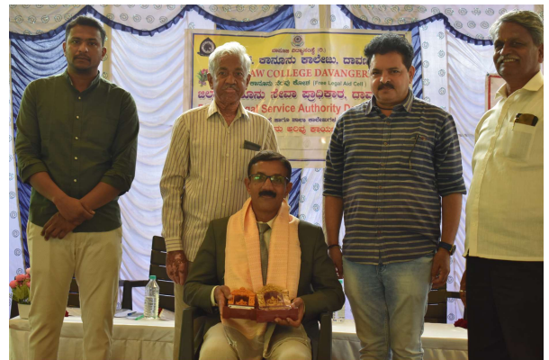
HONOUR TO THE PRINCIPAL