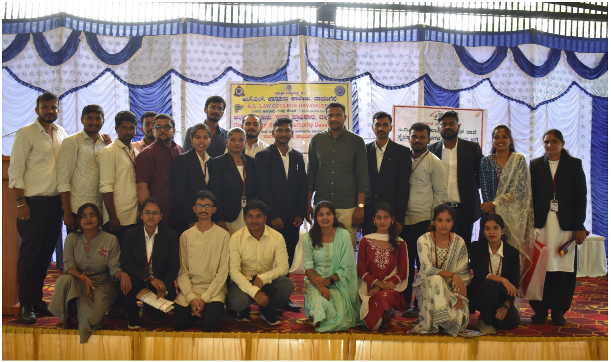
GROUP PHOTO OF R L LAW COLLEGE STUDENTS