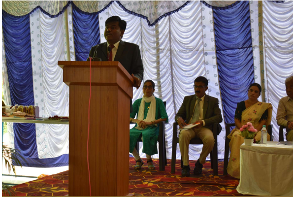
INAUGURAL SPEECH BY HON'BLE MAHAVEER M KARENNANAVAR